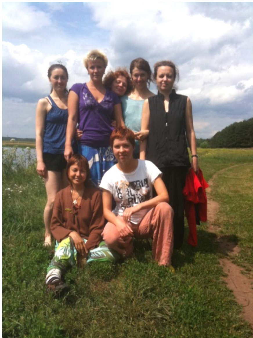
Лаборатория Аутентичного Движения 2011